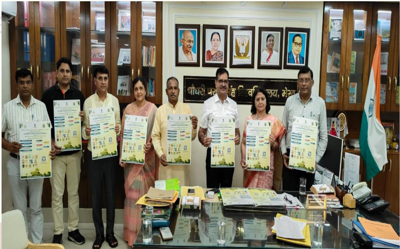
C.C.S. University, Meerut N.S.P.C. Releasing of Poster