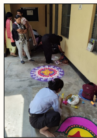
Students showcasing their creativity through beautiful 'Rangoli' designs during the competition.