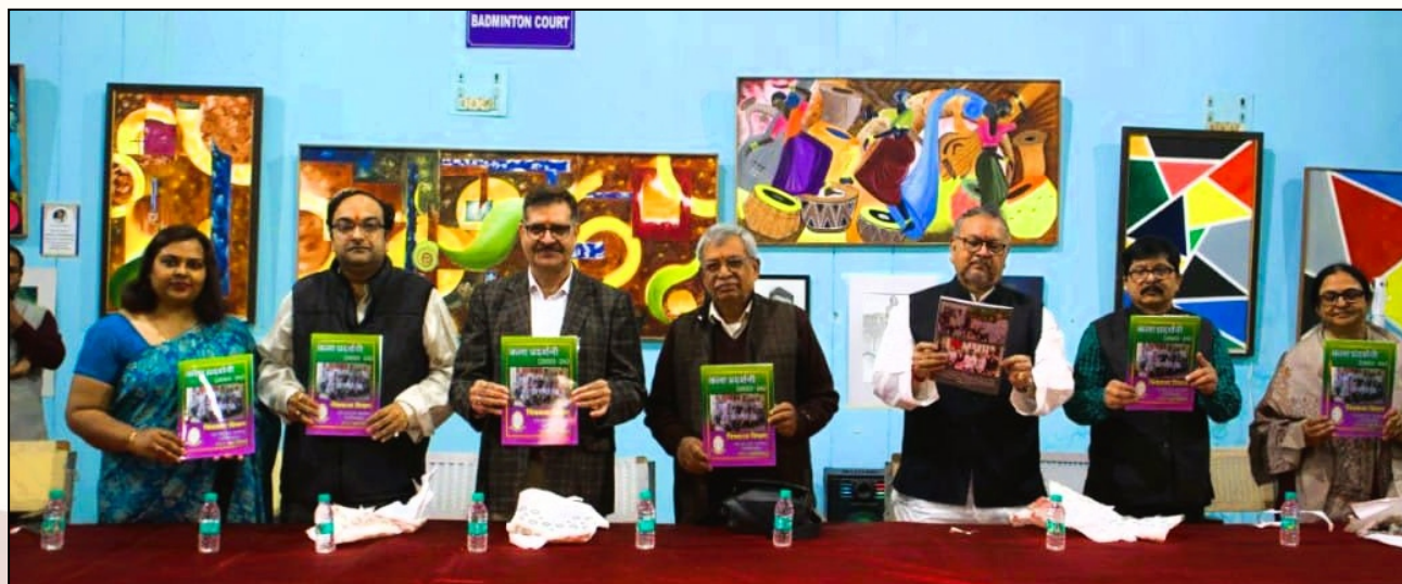
Esteemed dignitaries unveiling the catalogue during exhibition and making a moment of pride and celebration.