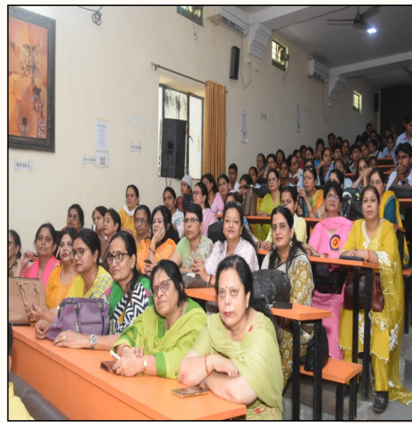
Teachers and students attentively listening to the speaker during annual event