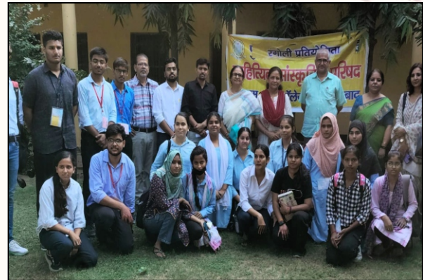
Teachers with participants of the 'Mehandi Competition' celebrating creativity and teamwork.