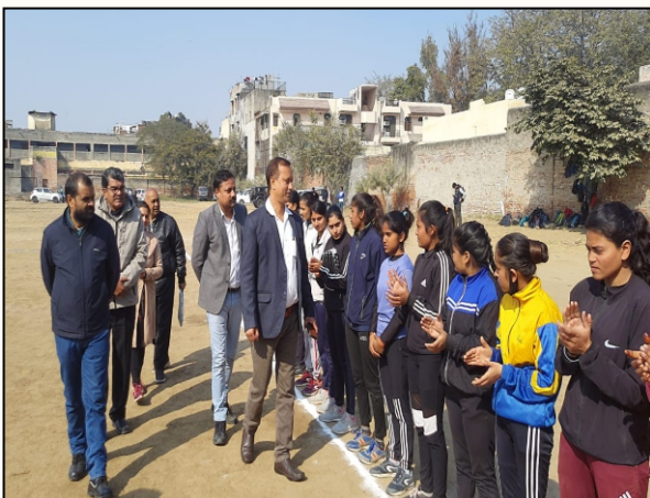
Opening ceremony filled with encouragement and motivation as dignitaries interact with players before the game begins.