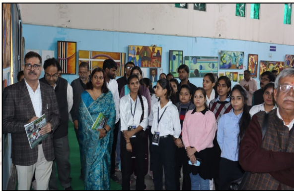
Principal sir along with guests and students during Drawing & Painting Exhibition