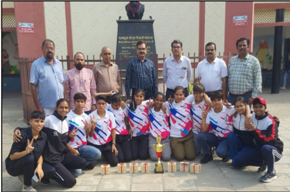
Sports stars of our college celebrating their victory with the principal and members of the department of physical education.