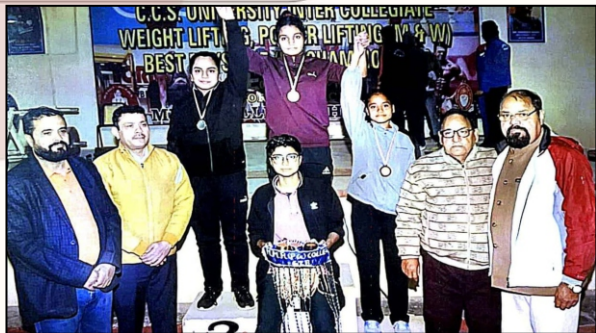
Victorious moment at the CCS University Inter Collegiate Championship as winners proudly receive the medals and celebrate success on the podium.