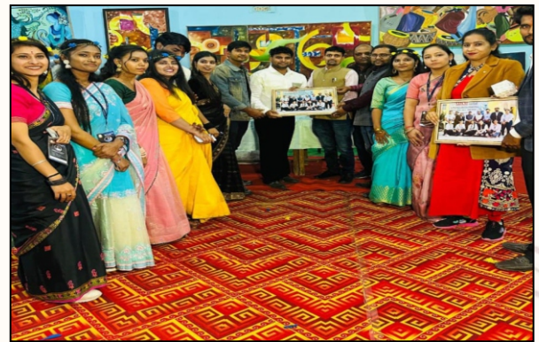
Faculty and students posing together during Exhibition.