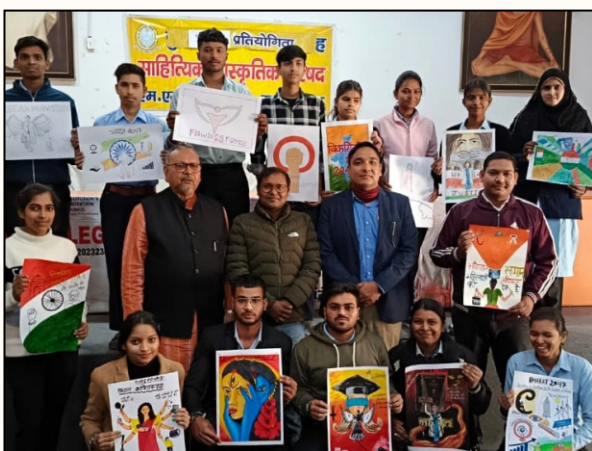
Students proudly showcasing their creative artwork during the poster competition.