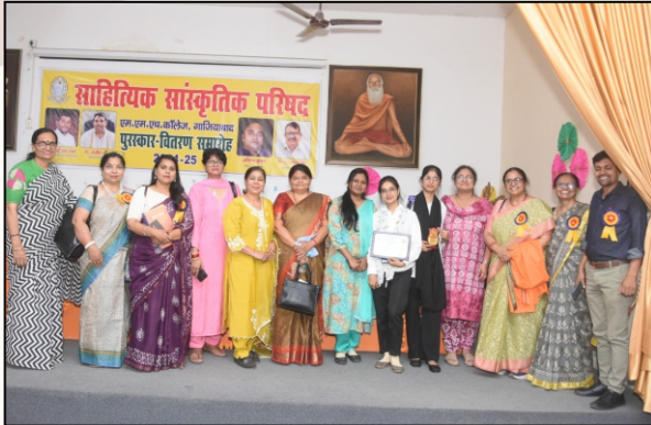
Convener and members of cultural committee gathered at the sahtyik sanskritik parishad award ceremony, celebrating art, literature and culture.