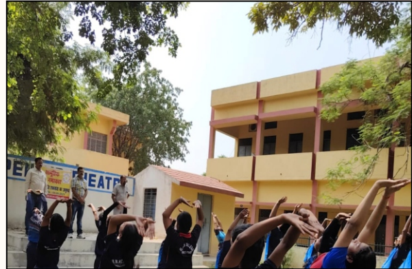
Students embracing Wellness through yoga on campus.