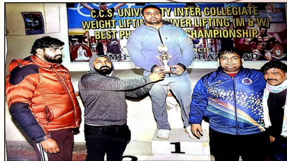
Winners are lifting the trophy with pride.