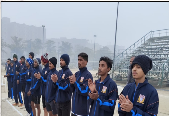
Team Spirit and determination on display at the sports ground.