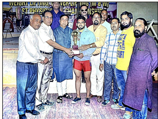
Champion being felicitated with a trophy for his outstanding performance in the weightlifting.