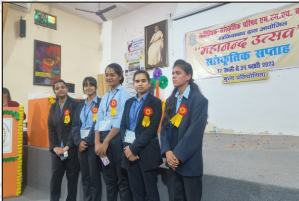
Our dedicated volunteers: The pillars of cultural events.