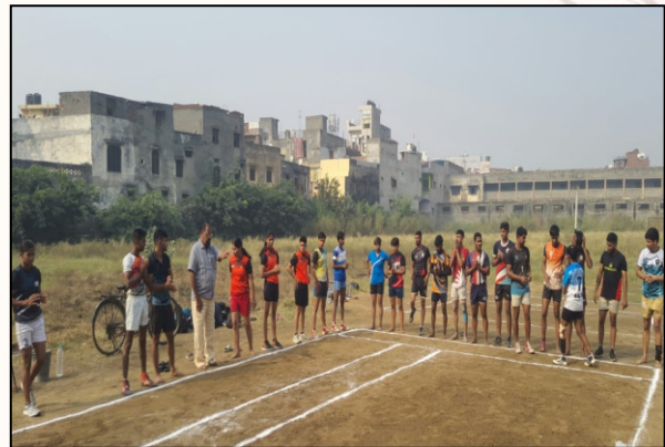
Players geared up with energy and excitement, ready to begin the game.