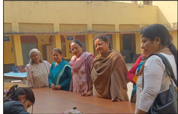
Students showcasing creativity in the 'Best out of waste' competition under the guidance of teachers.