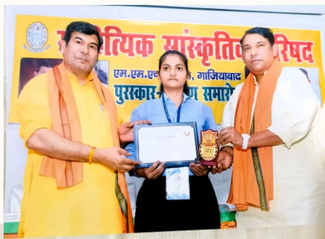
Student honoured with award and certificate by distinguished Chief Guests