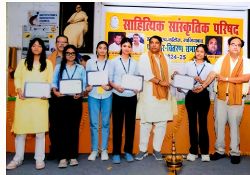
Esteemed Chief Guests alongwith Principal presenting certificate to students in recognition of their achievements